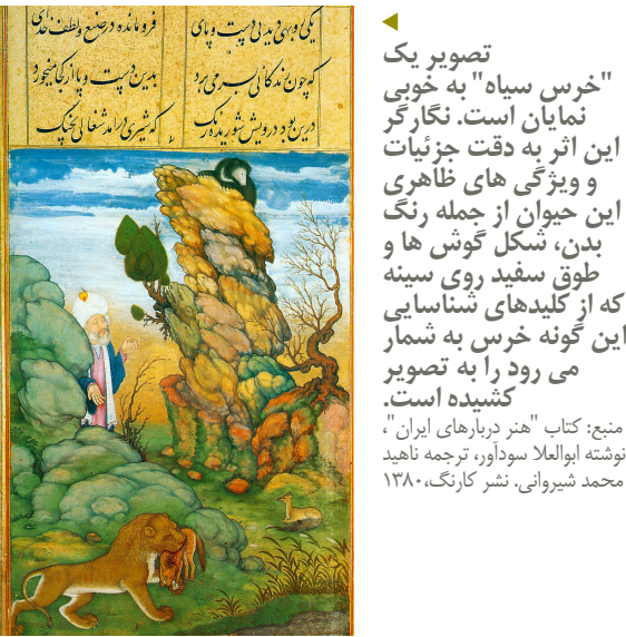
منبع: کتاب "هنر دربارهای ایران"، نوشته ابوالملا سوداور، ترجمه ناهید محمد شیروانی، نشر کارنگ، ۱۳۸۰

واژهٔ خرس از ریشه اوستایی آرَشَه areas – مشتق شده است. در فارسی باستان کلمهٔ "ارشام" ،که نام جد داریوش اول هخامنشی است، از همین ریشه مشتق شده است، به این ترتیب که "arsa" به معنی خرس در فارسی باستان با "ama" به معنی زور ترکیب شده و جمعا ترکیب "arsam" به معنی نیرو و قدرت خرس یا دارای زور خرس حاصل شده است. خرس که می‌آید، سنجاب‌ها فرار می‌کنند. منظور