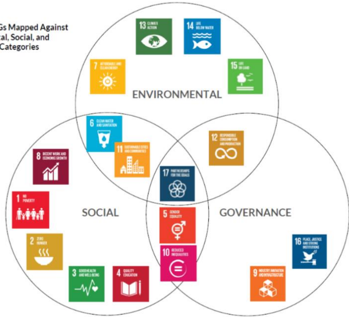
Figure 1: SDGs Mapped Against Environmental, Social, and Governance Categories